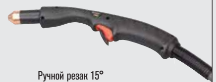
Ручной резак 15°