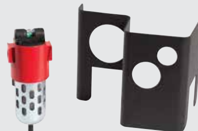
Воздушный фильтр Eliminer с крышкой