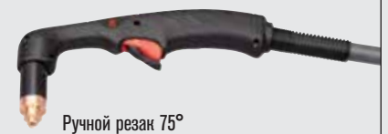
Ручной резак 75°

(дополнительные варианты резаков см. на веб-сайте www.hypertherm.com )