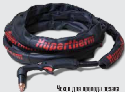
Чехол для провода резака